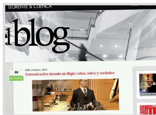
El blog de Llorente & Cuenca Blog corporativo de LLORENTE&CUENCA.