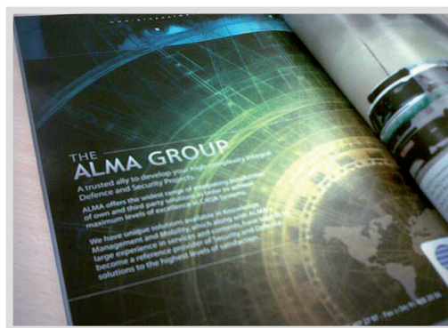
Grupo Alma Anuncio para Libro del 60 Aniversario de la OTAN