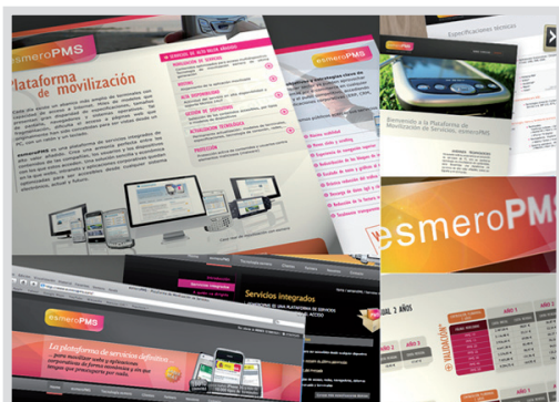
esmeroPMS Identidad corporativa: web, logo, folletos....