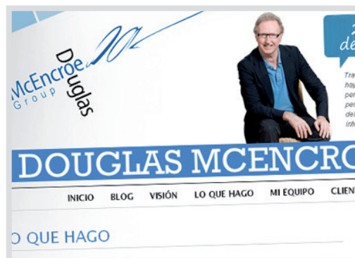
www.douglasmcencroe.com Portal corporativo para Douglas Mcencroe