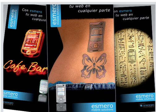
esmeroPlatform Diseño de serie de displays publicitarios