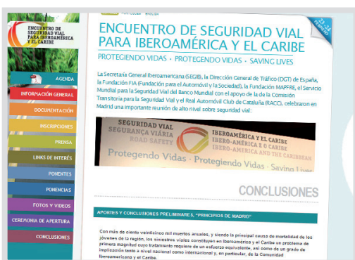
www.segib.org/foroseguridadvial Web para el Primer Foro de Seguridad Vial (SEGIB)