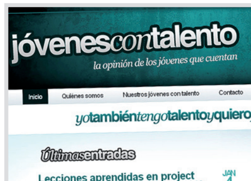
www.jovenescontalento.com iniciativa de KPMG con los mejores bloggers jóvenes con más talento.